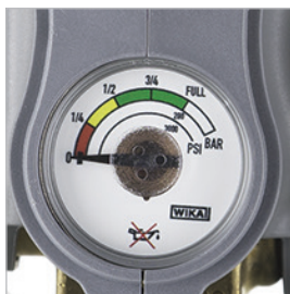
Misurazione permanente del contenuto